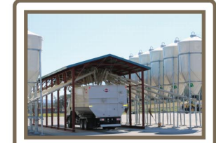
センター内の飼料タンク