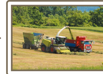
フォーレージハーベスターでの作業