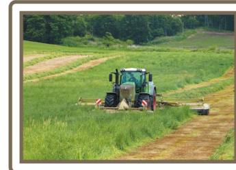
モアコンディショナーでの牧草刈取り

6月になると各地で牧草の一番草刈り作業が始まります。皆さんも収穫風景を見かけたことがあると思います。牧草を刈って、散らして乾燥させ、集めて丸め、白や黒のビニールに包まれて転がっているものや、ダンプカーやトラックと並んで走りながら牧草を積んで行くところなど。夏の間1年分を収穫し、保存食のサイレージを作ります。