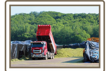
バンカーサイロへ搬送