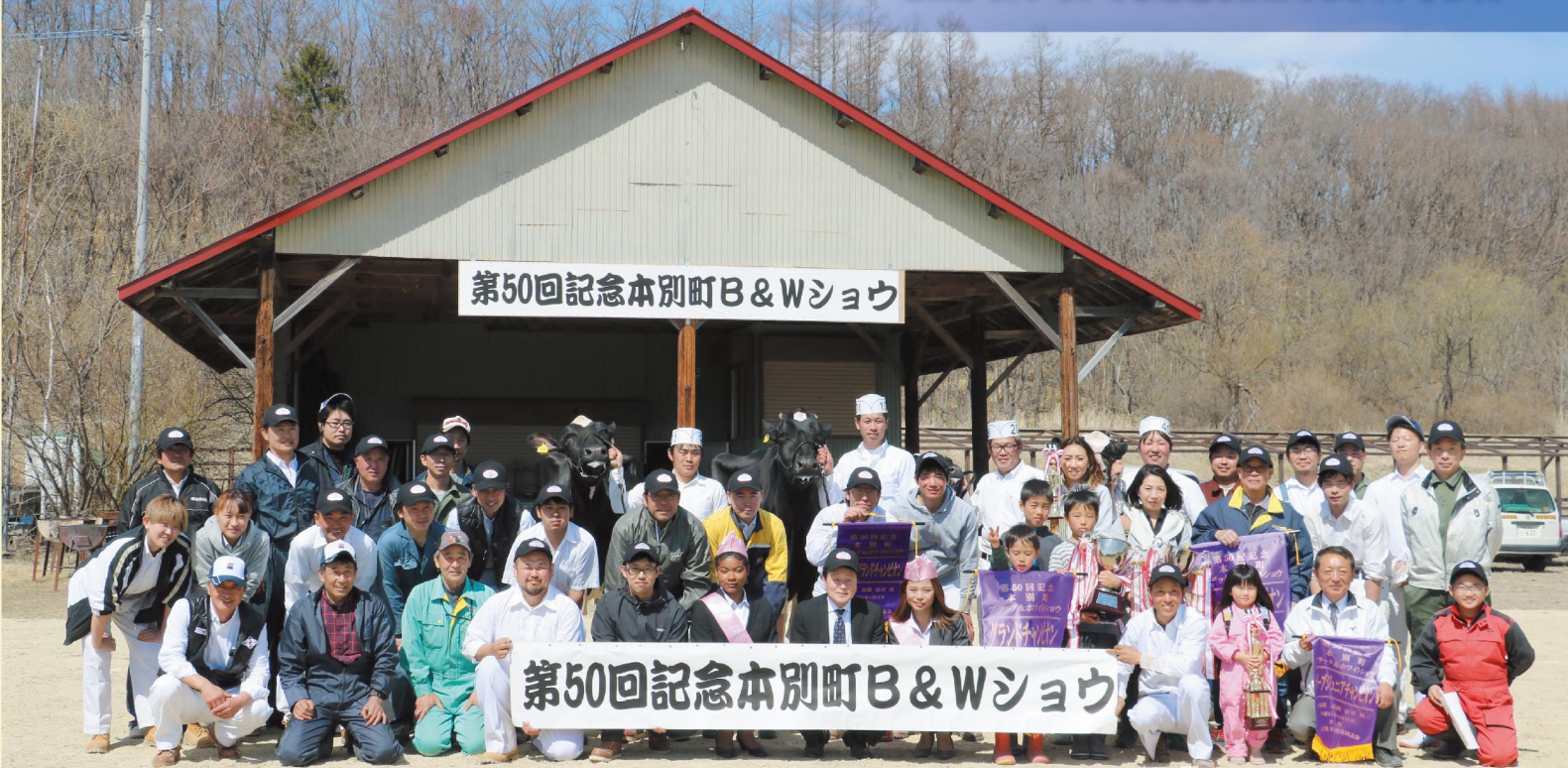
第50回記念本別町B&Wショウ

JAや農畜産物をもっと身近に! JAと地域の皆様をつなぐ情報紙です! これから、いろいろな情報をお知らせしていきます。