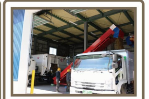
配送車にTMRを積んでいます